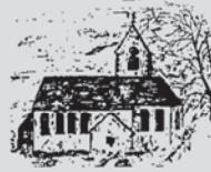
St. Georg Wildpoltsweiler