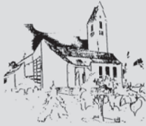
St. Maria Rosenkranzkönigin Neukirch