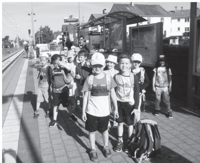
Text und Bild: Susanne Georgi

Heute war ein ganz besonderer Tag! Um 8.15 Uhr tra- fen sich alle Jumbos im Kindergarten, um gemeinsam zum Bahnhof in Langenargen zu laufen. Die Aufregung war groß! Nach kurzer Zugfahrt erreichten wir das Naturschutz-Zentrum in Eriskirch. Dort wurden wir freundlich empfangen. In der großen Ausstellung gab es viele verschiedene Stationen über die Tiere und In- sekten am und im Bodensee, die uns ausführlich er- klärt wurden. Wir hatten auch die Möglichkeit Ver- schiedenes auszuprobieren. Anschließend bekamen wir eine Führung durch das Naturschutzgebiet. Nach einer ausgiebigen Picknick-Pause konnten wir gestärkt auf Frösche- und Insektensuche gehen. Dazu bekamen wir Lupenbecher und Käschchen! Das war spannend! Der Er- kundungsweg an der „Schussen“ entlang führte uns an unsere Endstation bei den „Wasserfrauen“. Dort hatten wir Zeit für eine 2. Vesperpause und zum Spielen bis wir abgeholt wurden. Es war ein erlebnisreicher, spannender und sonniger Ausflug.